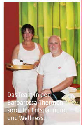
Das Team in den Barbarossa-Thermen sorgt für Entspannung und Wellness.

Weitere Informationen gibt es auf der Website. Gebucht werden kann die Bali Massage unter (07161) 6101-630.