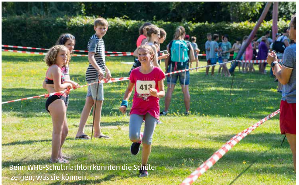
Beim WHG-Schultriathlon konnten die Schüler zeigen, was sie können.